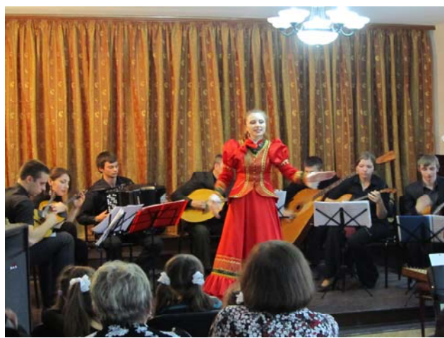
На фото: студенты отделений сольного и хорового народного пения и Инструменты народного оркестра.