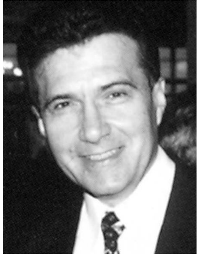
На фото: Куцёв В.М. заслуженный деятель искусств РФ, депутат Государственной думы

Множество выпускников являются руководителями творческих коллективов, заведующими кафедрами и директорами детских музыкальных школ.