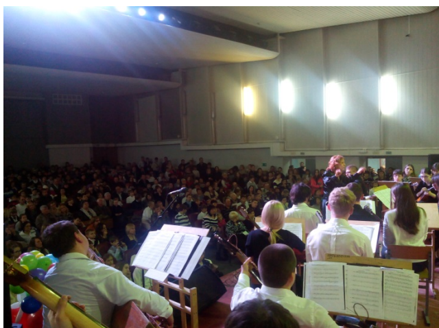
На фото: VIII-й областной конкурс «Дебют» в стенах Ростовского колледжа искусств.

Студенты отделения являются активными участниками и победителями областных, межрегиональных, всероссийских и международных конкурсов, таких как: Открытый Всероссийский конкурс исполнителей на народных инструментах (Астрахань), Международный конкурс исполнителей на баяне и аккордеоне им. братьев Воеводиных (Луганск), Международный конкурс исполнителей на баяне аккордеоне «Весенние голоса» (Москва), Открытый Всероссийский конкурс баянистов-аккордеонистов «Большой приз Дона» (Ростов-на-Дону), Международный фестиваль конкурс «Веселая радуга» (Одесса), областной конкурс юных исполнителей на народных инструментах "Дебют" (Ростов-на-Дону) и других. Только за этот год наши студенты 45 раз становились лауреатами различных конкурсов.