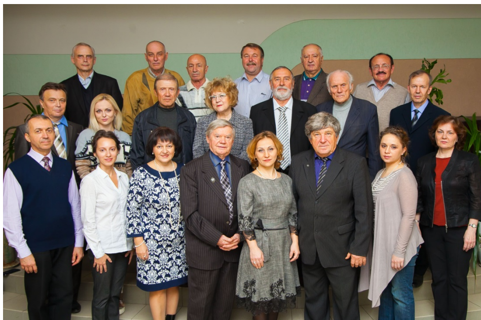
На фото: преподавательский состав отделения инструменты народного оркестра.

Наши преподаватели занимаются не только обучением студентов, но и ведут широкую концертную деятельность.