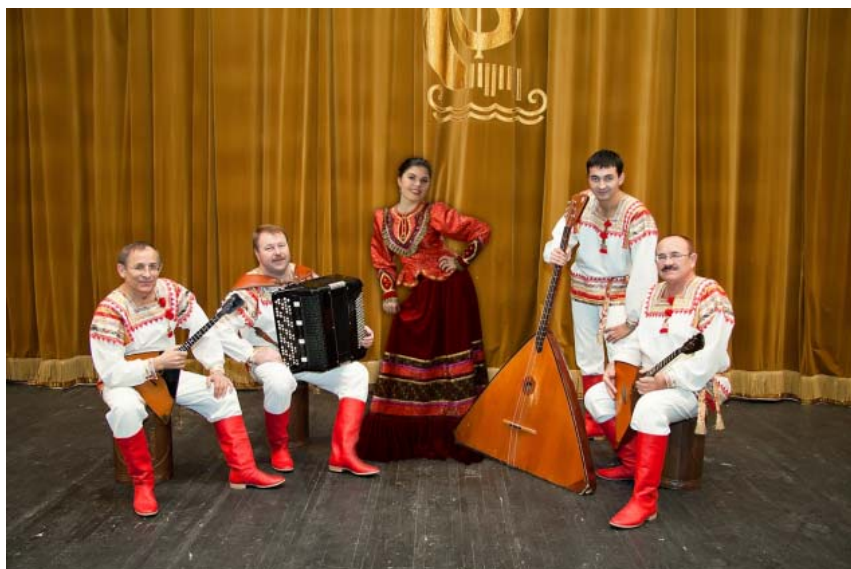
На фото: Ансамбль русских народных инструментов «Донцы».

Студенты отделения являются активными участниками и победителями областных, межрегиональных, всероссийских и международных конкурсов, таких как: Открытый Всероссийский конкурс исполнителей на народных инструментах (Астрахань), Международный конкурс исполнителей на баяне и аккордеоне им. братьев Воеводиных (Луганск), Международный конкурс исполнителей на баяне аккордеоне «Весенние голоса» (Москва), Открытый Всероссийский конкурс баянистов-аккордеонистов «Большой приз Дона» (Ростов-на-Дону), Международный фестиваль конкурс «Веселая радуга» (Одесса), областной конкурс юных исполнителей на народных инструментах "Дебют" (Ростов-на-Дону) и других. Только за этот год наши студенты 45 раз становились лауреатами различных конкурсов.