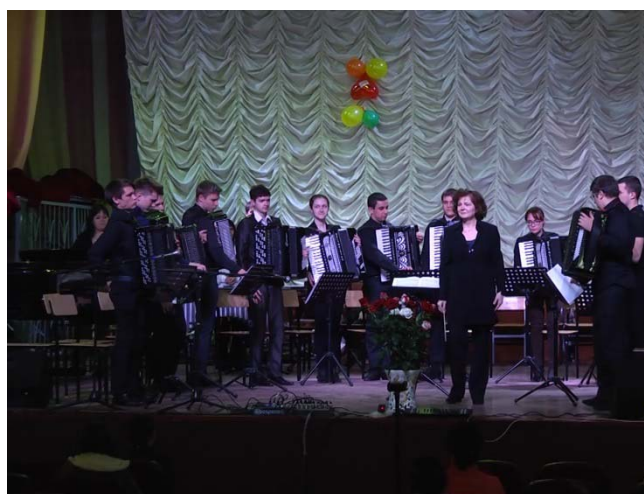
На фото: Машина О.А. и камерный оркестр баянистов

На протяжении 90 лет отделение подготавливает и выпускает талантливых исполнителей, преподавателей, мастеров своего дела, достойно продолжающих традиции исполнительства на русских народных инструментах. Хочется пожелать педагогам и студентам отделения «Инструменты народного оркестра» дальнейших успехов и побед.